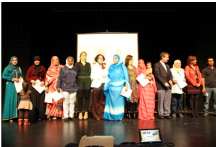
Entrega de diplomas a alumnas del Sagrado Corazón de Balos

Las religiosas del Centro, junto a cuatro personas voluntarias (todas ellas docentes), atienden al alumnado, separado por grupos según el nivel de aprendizaje: desde personas analfabe-