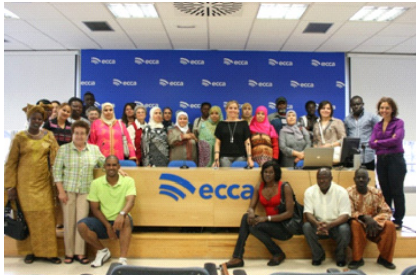
Visita a la sede central de Radio ECCA

Cada grupo / clase se reúne dos veces por semana en sesiones de hora y media y, en ese tiempo, escuchan las clases radiofónicas, profundizan en los contenidos