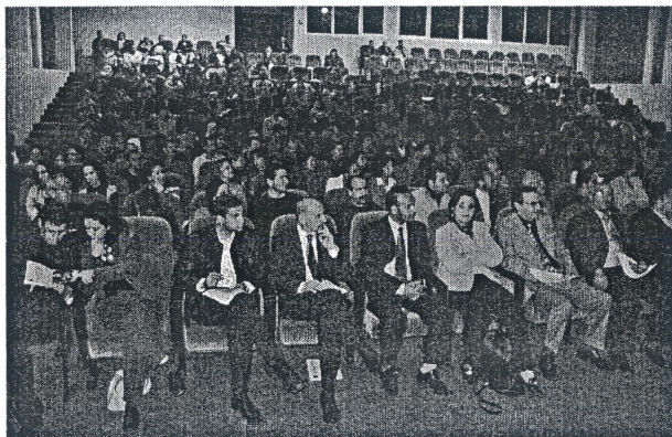
Clausura de un curso especial realizado en Agadir

Marruecos es otra de las apuestas, iniciándose esta etapa de colaboración en 2003 impartiendo un curso en español y del que hasta el momento se han desarrollado cinco ediciones, formándose a unas 1800 personas a través de cursos On Line, dirigido a trabajadores de empresas canarias en Marruecos y viceversa, con el fin de prepararles y darles un mayor nivel de conocimiento del país.