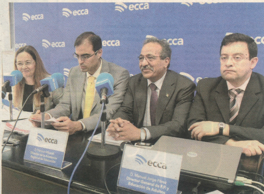
Momento de la rueda de prensa en la que se presentó el nuevo proyecto educativo.