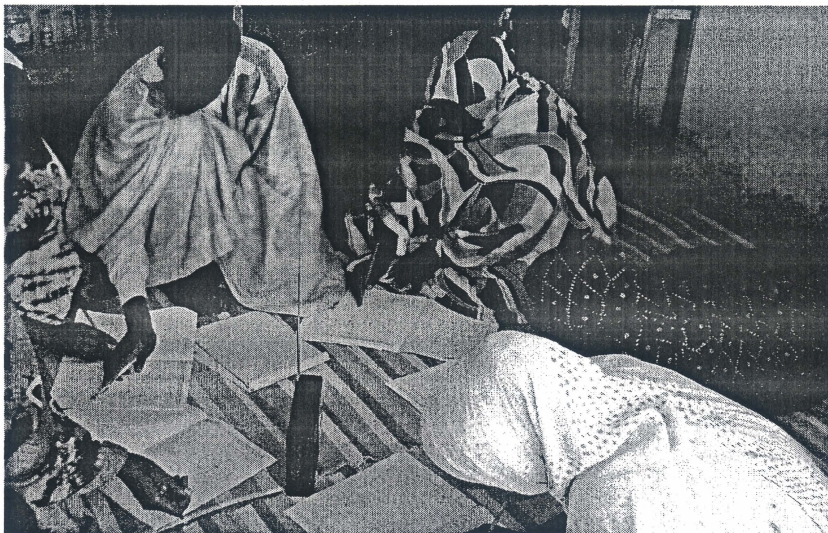
Un grupo de adultos en plena tarea tomando clases a través de la radio en Mauritania

Fue Mauritania quien abriera esa brecha en la larga lista de proyectos realizados y pendientes de llevar a cabo, siendo en la ciudad de Nouadhibou donde se realizaría el primer Proyecto de Desarrollo, sobre Salud y Participación, pasando