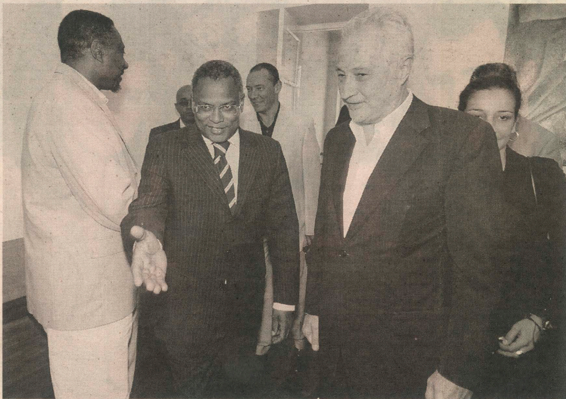
El presidente del Gobierno de Canarias, Adán Martín, y el primer ministro de Cabo verde, José María Neves.

Proyecto ECCA. Durante los encuentros con las entidades de alfabetización en Cabo Verde, el presidente regional asistió a la fir-