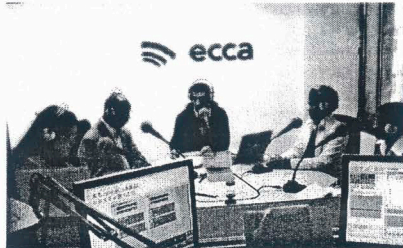
Expedición de Cabo Verde entrevistados la pasada semana en Radio Ecça

lo estuviera en décadas pasadas Canarias. Cabo Verde tiene transferidos los derechos del sistema Ecça.