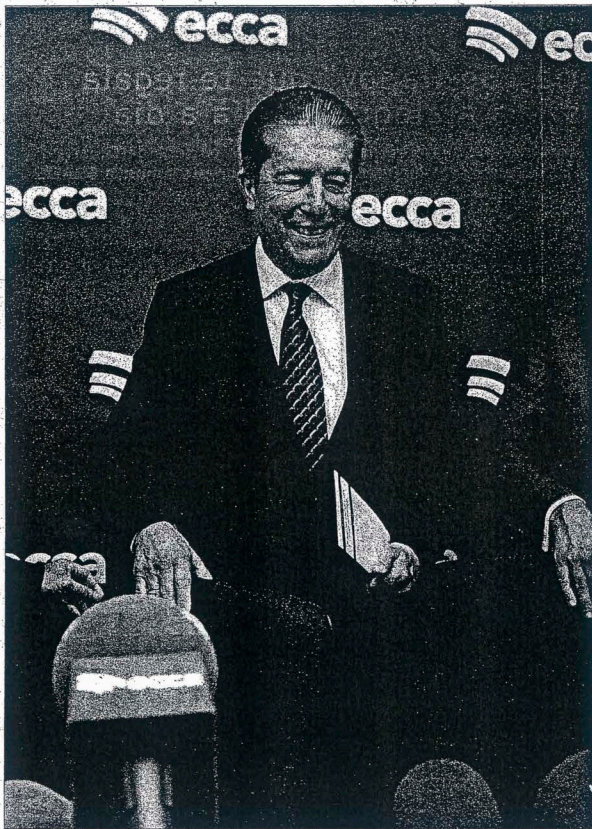
Sereno. Mayor Zaragoza, ayer, en el acto de apertura del curso de Radio Ecca.

El tercer factor favorable con el que se cuenta es la «participación virtual», ya que, a través de internet o de un sms los ciudadanos pueden expresar su opinión a distancia.