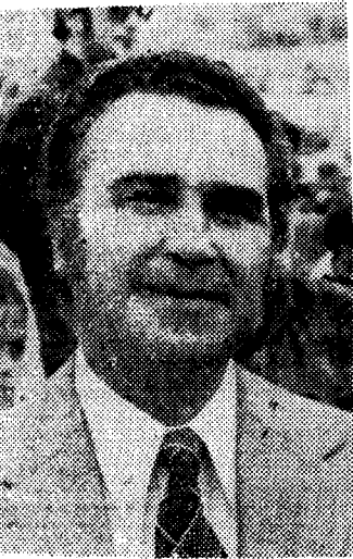
El alcalde de la ciudad hizo entrega de "La Palmera de Plata".