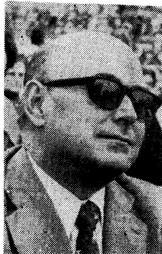
El gobernador civil, en sus palabras.