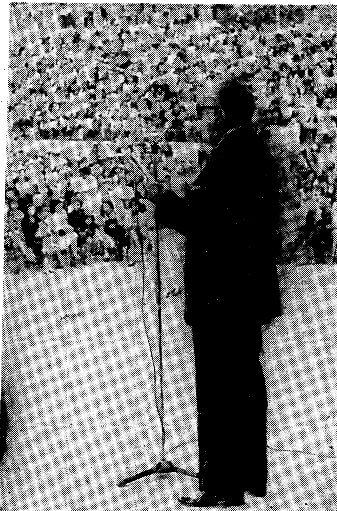
Matías Prats: Voz cálida y vibrante. El gran pregonero.

Tomó luego la palabra el gobernador civil de la provincia, quien dijo que "la historia de Ecca la habían escrito los alumnos que, en esta mañana, habían testimoniado verbalmente la labor de la emisora. Ecca ha ofrecido este homenaje al pueblo canario y yo, en su nombre, lo hago extensivo a los que han hecho posible Radio Ecca".