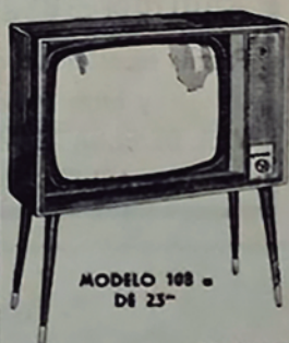
MODELO 108 D1 25"