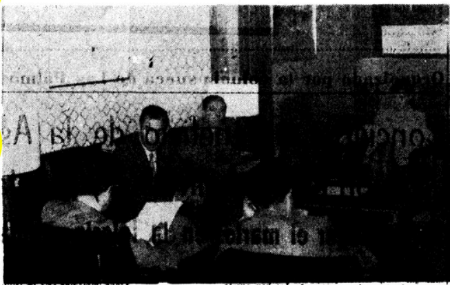
La foto de Urquijo muestra la reunión de prensa en la que se informó del Curso de Promoción al Bachillerato de Radio Ecca.

Del 5 de Enero al 20 de Septiembre, previa reválida, podrá seguir el tercer año