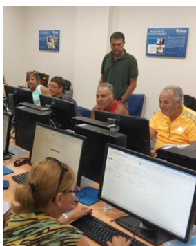
La alfabetización digital es el reto de nuestro tiempo

Una organización eficiente conformada por equipos humanos competentes y comprometidos con la misión e identidad institucional