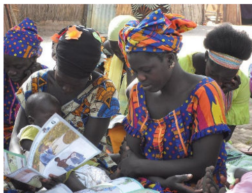
Cooperación ECCA en África Occidental

los subrayados en la problemática de cohesión social-. Del mismo modo, nos unimos a los compromisos de la muy reciente Declaración de Incheon (mayo 2015) que promueve el derecho a la educación como contribución a los Objetivos de Desarrollo de Naciones Unidas 2030 .