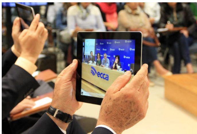
Seminario Nacional ECCA / Innovación tecnológica y pedagógica