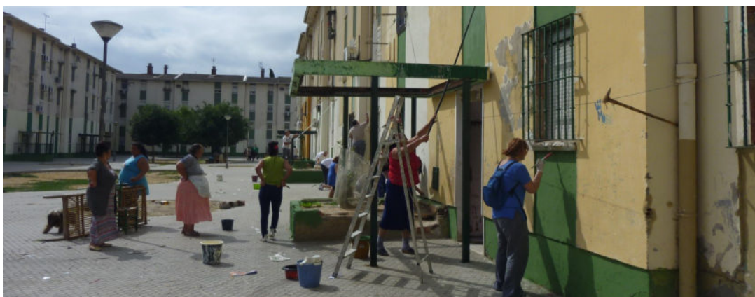
Intervención social por personas de ECCA Sevilla

Se habrá conseguido la financiación, las alianzas y la implantación de Acciones Formativas que respondan a las demandas educativas de las personas con diversidad funcional