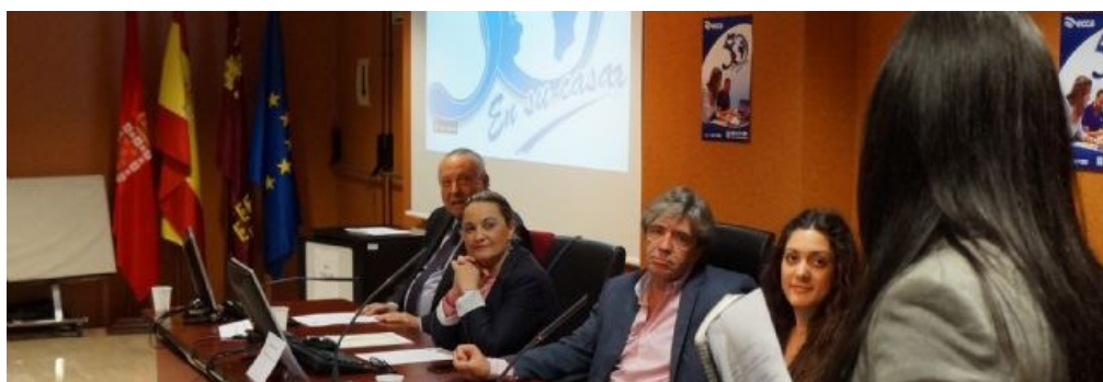
Clausura de curso en ECCA Murcia

Los equipos humanos conocerán poco a poco los focos del modo de proceder de las instituciones vinculadas a la Compañía de Jesús