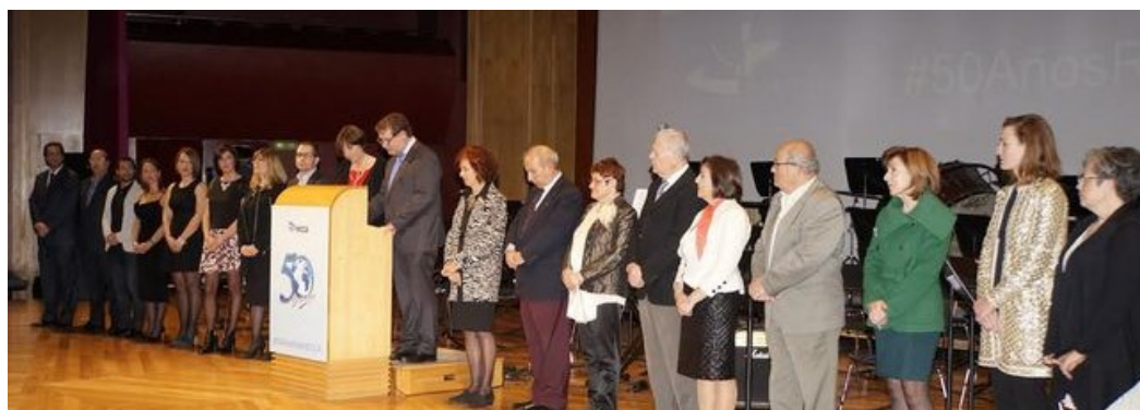
15 de febrero de 2015. En el Auditorio Alfredo Kraus, celebración del 50 aniversario de Radio ECCA

La persona que es servida, en lugar de ser ayudada, es obstaculizada en el desarrollo de su propia autonomía. Este concepto es el fundamento de la dignidad del ser humano. María Montessori, pedagoga y maestra.