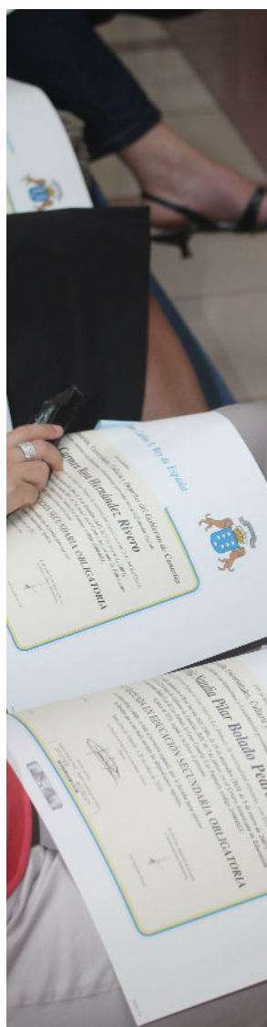
La lucha contra el abandono temprano: una meta de la Unión Europea

Los convenios de financiación con las administraciones públicas serán estables y apropiados para la naturaleza y actividad de Radio ECCA