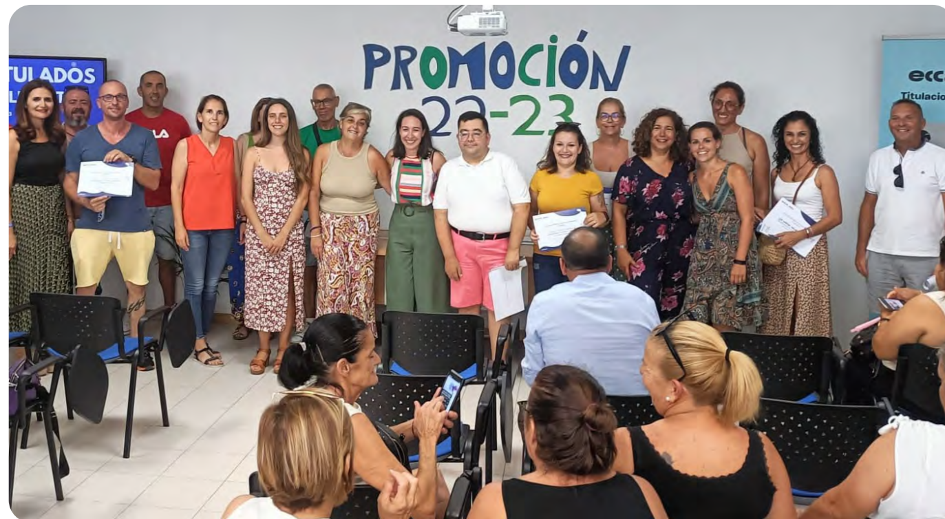
Entrega de certificados al alumnado titulado en GES y Bachillerato

Se han reformado 3 talleres escolares incorporando actividades interactivas subvencionado por el Cabildo de Gran Canaria.