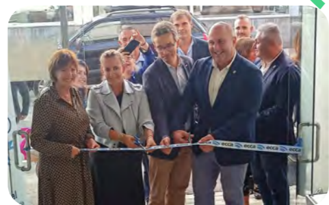
Nueva sede en Puerto de Rosario en Fuerteventura