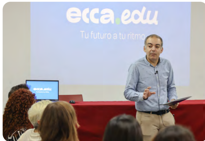
Presentación marca ecca.edu