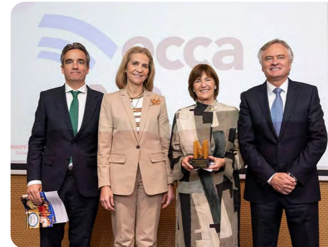
Reconocimiento de Fundación Mapfre a ECCA