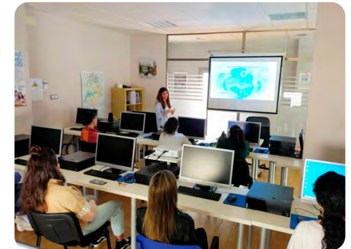
Proyecto de empleabilidad en Extremadura