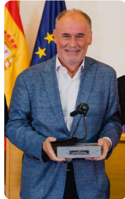
Fundación Arehucas premio ECCA a la responsabilidad social corporativa