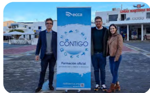
Nuevo Centro de Orientación en La Graciosa