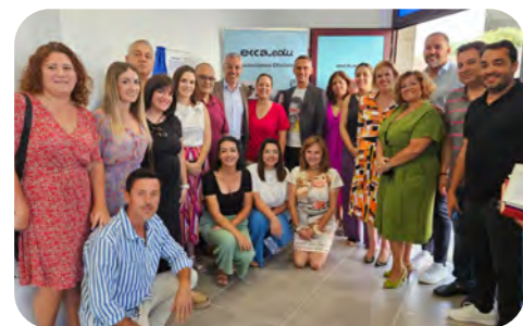
Nueva sede en Los Llanos en La Palma

24 100 alumnos/as en cursos de Aula Abierta